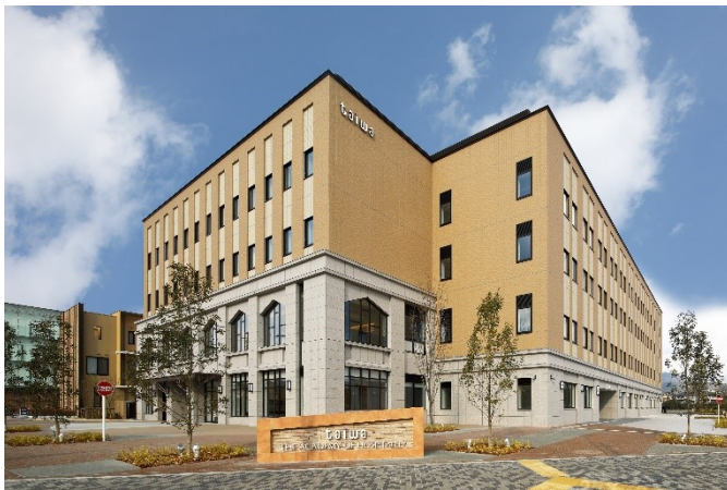
大和学園太秦キャンパス 外観